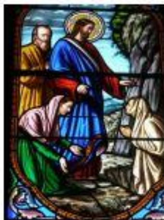
Apparition aux femmes - vitrail, église d'Arles (Cathédrale)

BAIER EPINES PRIERE BON LARRON GLOIRE RENIEMENT CAIPHE GOLGOTHA REPAS CALVAIRE JERUSALEM ROMAINS CENE JUDAS ROI CENTURION LINCEUL ROYAUME COURONNE OLIVIERS SIMON PIERRE CRUCIFIXION PAIN SERVITEUR CROIX PARTAGE TOMBEAU CYRENE PASSION TRAHISON DISCIPLES PHARISIENS TRAITRE DON PILATE VETEMENT VIN